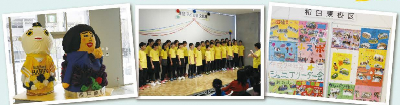
※写真は昨年度の様子